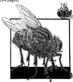
WERNER GUNTERSWILER, LA MOUCHE, 2012, 37 X 34 CM

Catalogue bilingue édité par l'Association suisse des Amis du découpage sur papier (84 pages)