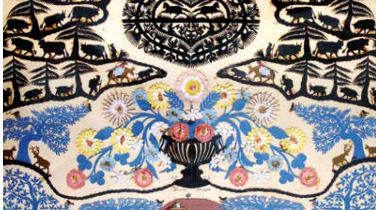
LOUIS DAVID SAUGY, BOUQUET (DÉTAIL), 1946, 28,5 X 40,5 CM