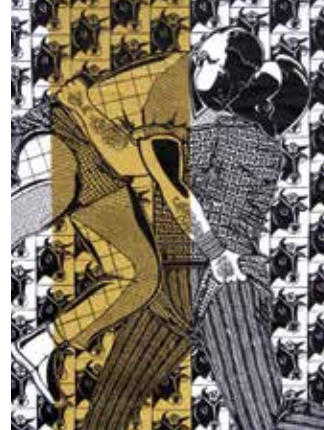
MONIKA FLÜTSCH, LE TAUREAU DOBI, 2012 86 X 68 CM