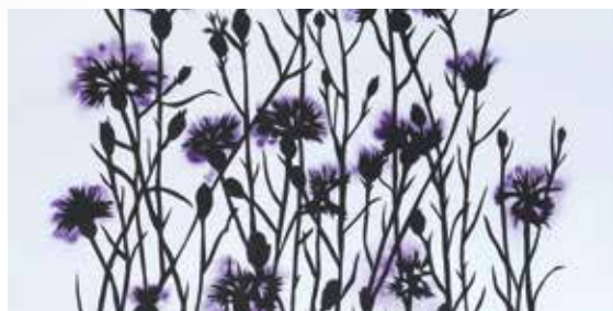
KATHARINA CUTHBERTSON, LES FLEURS DU CIEL (DÉTAIL), 2012 32 X 28 CM